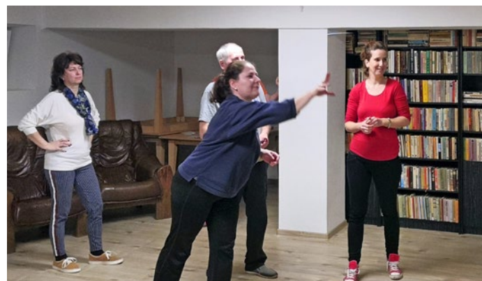
V našom regióne sa šípkam venujú aj dámy z Belže – a nedajú sa zahanbiť!