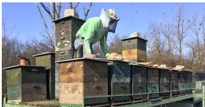
Včelár pri svojich úlohách