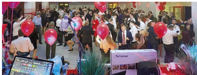
Valentínska atmosféra v Seni