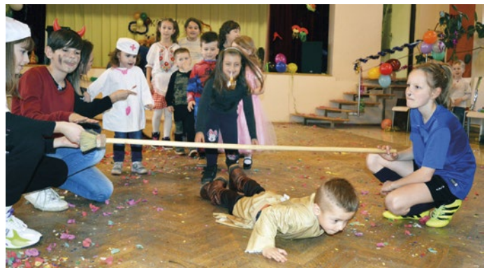
Z karnevalu v Nižnej Myšli

♥ Snehové kráľovstvo zavítalo aj do Valalík . Kultúrny dom zmenilo na rozprávku, kde snežili cukríky. Deti premenené na zvieratká a postavičky z príbehov šantili s rodičmi a snehuliakom Olafom na parkete. Napätie okúsili v tombole a na záver si mohli nabráť z čokoládového pokladu.