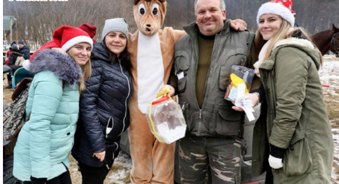
Foto na pamiatku s maskotom