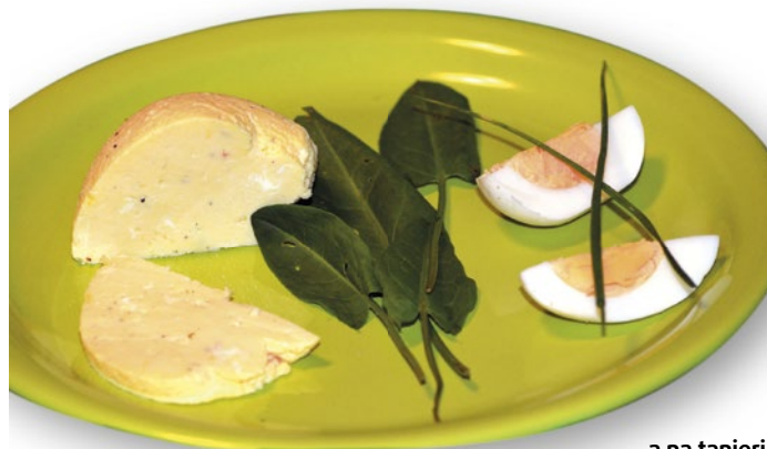
...a na tanieri