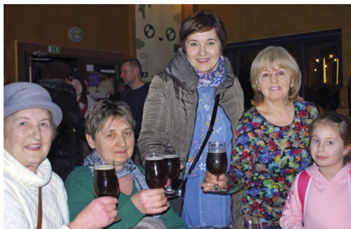
Komparzistky filmu Anežka z Gyňova s autorkou článku ochutnávajú po premiére tmavé pivko špeciálne rovnakého mena špeciálne pripravené k premiére

Fekálne vozidlo Anežka sa symbolicky plagátom uchádzalo na stránke www.hithit.cz o príspevky na financovanie. Úspešne. Tvorbu študentského filmu podporili fanúšikovia sumou asi 7 000 eur.