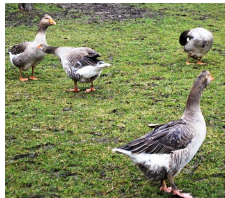
Husí, ale aj kačky, sliepky, ovce, kozy... to je tiež výbava farmy