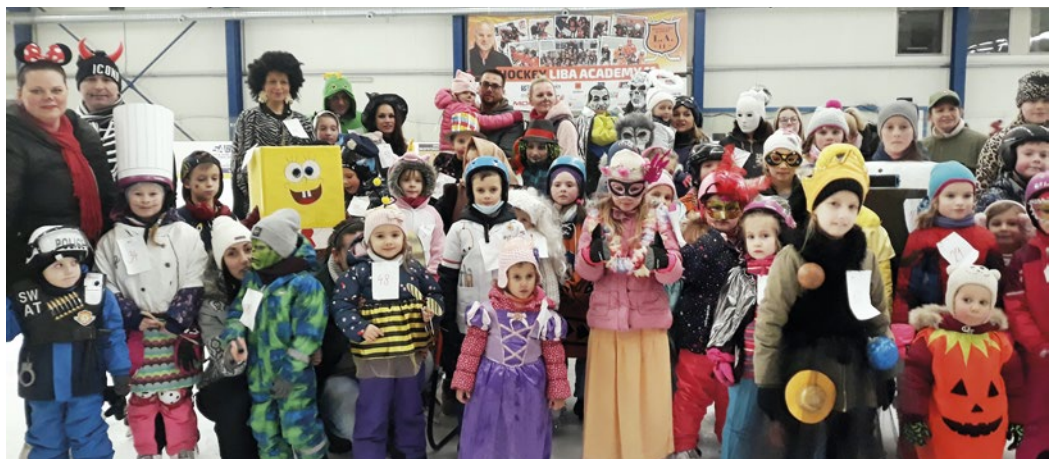
Oblúbenosť Trojkráľového karnevalu na ľade v Čani narastá. O zahriatie pestrých masiek sa stará kultúrna komisia