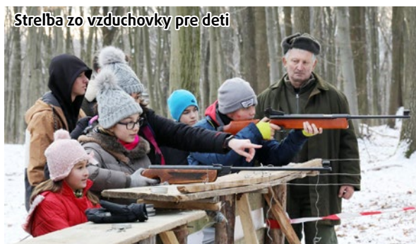
Strelba zo vzduchovky pre deti

Nadšení poľovníci majú veľký podiel aj na usporadúvaní každoročného podujatia Po srnčej stope v lesoch nad Skárošom. V 27. ročníku sa prípravy vzhľadom na určité organizačné zmeny dokončili prakticky v poslednej možnej chvíli, no oplátilo sa. Nikto, kto 6. januára prišiel, neolutoval. Približne 500 návštevníkov rôzneho veku z blízkeho i širokého okolia si užívali krásne počasie a množstvo aktivít pod holým nebom. Všetci boli zvedaví aj na tombolu.