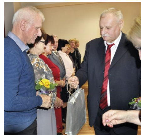
Činnosť Klubu dôchodcov Sokolany patrí k veľkej pomoci v obci