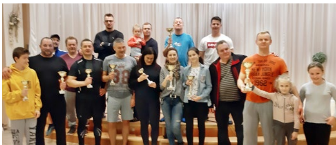
Obecné stolnotenisové záporenie zorganizovali po druhý raz v Kokšove-Bakši. Aj tu súťažili v troch kategóriách viac ako dva tucty účastníkov