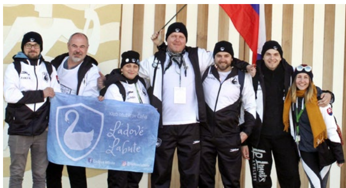
Naše labute v priestoroch slovinského olympijského veslárskeho centra

Samotné plávanie už bolo o niečo inom. Tréma, pocit zodpovednosti a chuť podať čo najlepší výkon sa stupňovali s blížiacim sa štartom. Pri príprave na rozplavbu by sa nervozita dala krájať. Keď kráčate k štartu a hlásia vaše meno a krajinu, je to neopísateľný pocit, na ktorý nik-