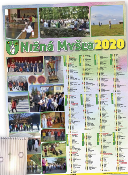
Nižnomyšlianský kalendár „z veľkej výšky“