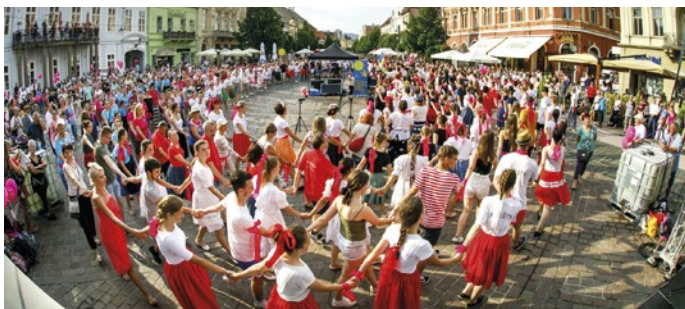
Slonovratová špirála z Karičky na Hlavnej 2019