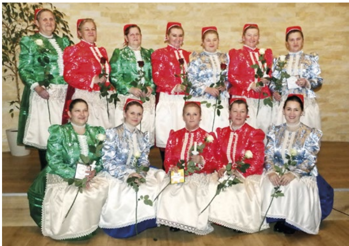
Na tretí kroj sú Paradne nevesti hrdé

Ženskú spevácku skupinu z Valalík zdobí nový autentický kroj z obdobia 2. svetovej vojny. Ženy na ňom pracovali celý rok. Najprv urobili prieskum, zhľadali dobové fotografie, články v novinách. Podľa pamätníčok z obce vybrali strih a materiál. Aby zachovali originalitu, všetko konzultovali s historikmi aj vedúcimi iných folklórnych telies.