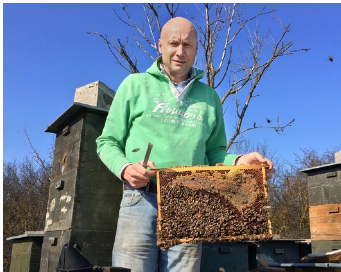
Pravidelná kontrola úlov napomáha zamedzenie šírenia chorôb medzi včelstvami

Nestriekajte ovocné stromy v plnom kvete. Ak, tak podvečer, keď včela nelieti. Aby ste prilákali včely do záhrady, vysádzajte medonosné rastliny. Napríklad facéliu, kvitne štyri až päť mesiacov v roku. Vysadte okrasnú levandulu alebo malinu a čericu, rovnako aj ovocné stromy ako jablone, hrušky, slivky, marhule, broskyne alebo čerešne.