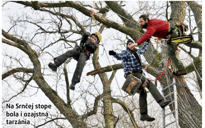
Na Srnčej stope bola i ozajstná tarzážia