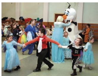
Najobľúbenejšie zimné postavičky vo Valalíkoch