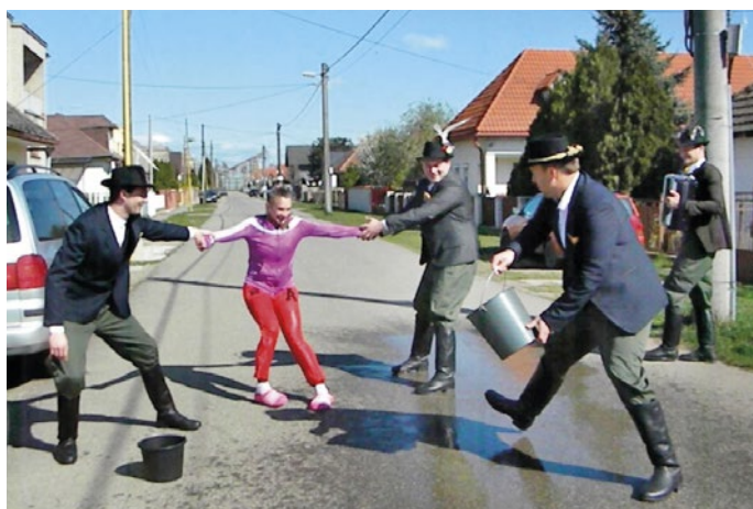
Najprv Nie! Nie! Potom radostné obdarúvanie za dobré oblievanie. Na snímke mládí z FS Abovčan.

Keďže radosť z jari, pučiaceho rastlínstva a príchodu mláďat na svet sa odpradáva spájal s oslavami, úkony