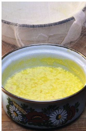
Hrudka v hrnci...