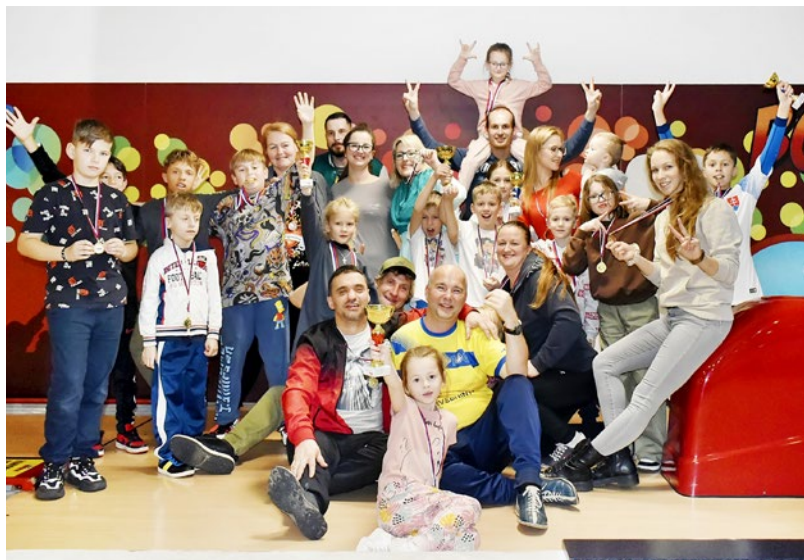
Veselá partia na bowlingu rodinných tímov