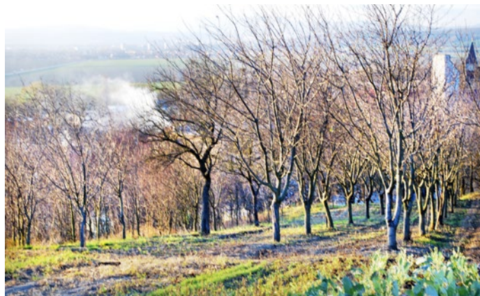
Ovocinárstvo v Nižnej Myšli má mocnú tradíciu. Jej dozvukom je malý čerešňový sad na svahoch kopca pri kostole... a tiež nádherná stará čerešňa, od ktorej máme krásny výhľad na Košickú kotlinu