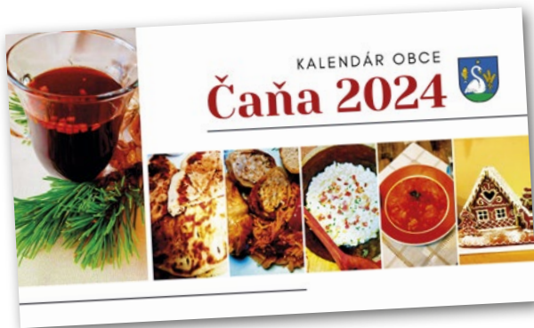
Kalendár na rok 2024 - slinky sa zbierajú už pri titulnej strane