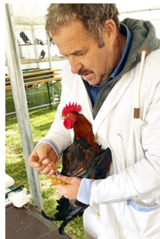
Zdrobnené plemená majú sytejšiu farbu a výraznejšiu kresbu