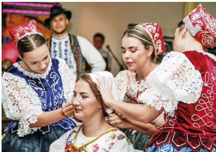
Mocná chvíľa pre nevestu. Pamätá si ju celý život. Keď jej veniec snímajú a čepiec dávajú