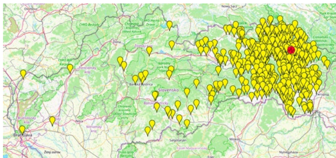
Mapa pozorovaných účinkov októbrového zemetrasenie na území SR na základe doručených seizmických dotazníkov. Červeným je označené epicentrum.

epicentra 17,8 km blízko Vranova nad Topľou aj s početnými dozvukmi zasiahlo Slovensko aj susedné štáty - Ukrajinu, Poľsko, Maďarsko. Spôsobilo veľké škody na kostoloch, domoch i na ďalšom majetku. Na ich odstraňovanie ešte stále pomáha samospráva aj štátne orgány. Našťastie, v našom mikroregióne výraznejšie škody neboli zaznamenané. Podľa vyjadrenia Slovenskej akadémie vied, ktoré zverejnila na svojej internetovej stránke, spomínané trasenie Zeme bolo na východnom Slovensku najväčšie od roku 1914 a v rámci celej krajiny od roku 1930. kčj