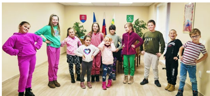
Deti sa stretávajú a cvičia na verejné vystúpenia