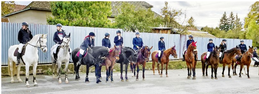
Slávnostný nástup koní