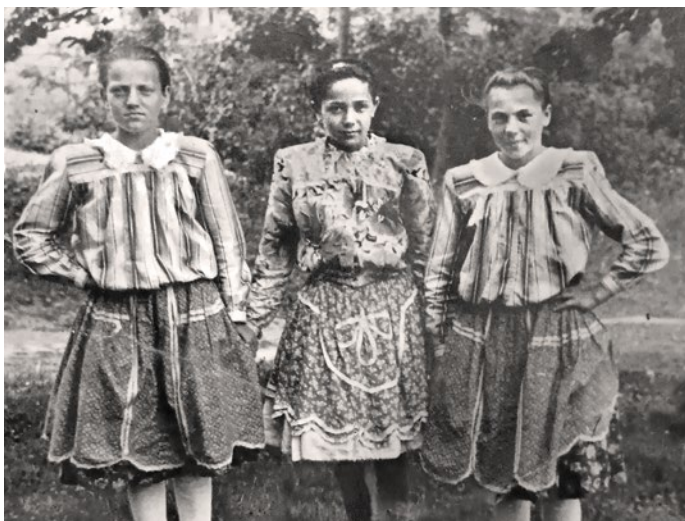
Dievčatá v bežnom dni – aj jednoduchá podoba kroja im veľmi pristala

Stranu pripravila Katarína Čaniová