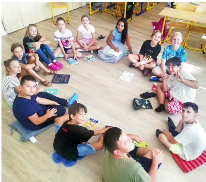
Aj slovenčina môže byť dnes v škole iná, hravá a objavná

Máte aj vy vo svojej škole inšpiratívnych učiteľov? Napíšte nám o nich a predstavíme ich v niektorom z ďalších čísel nášho časopisu.