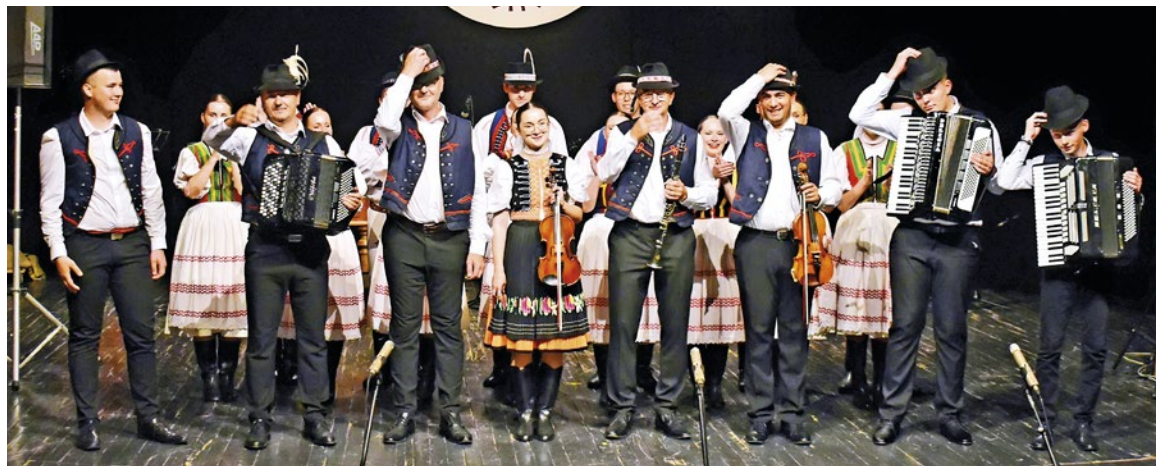
Bakšanski parobci pohľadili duše Bosniakov