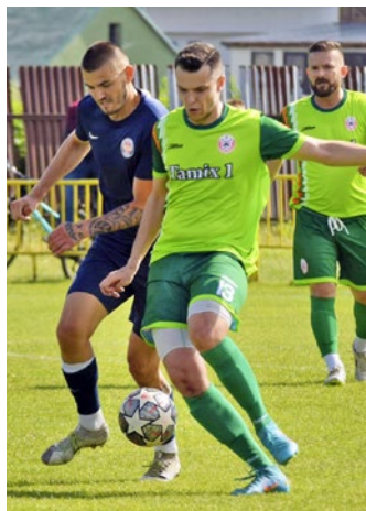
Hráči v zápale hry