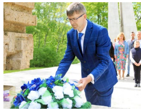
Starosta Skároša pri kladení vencia