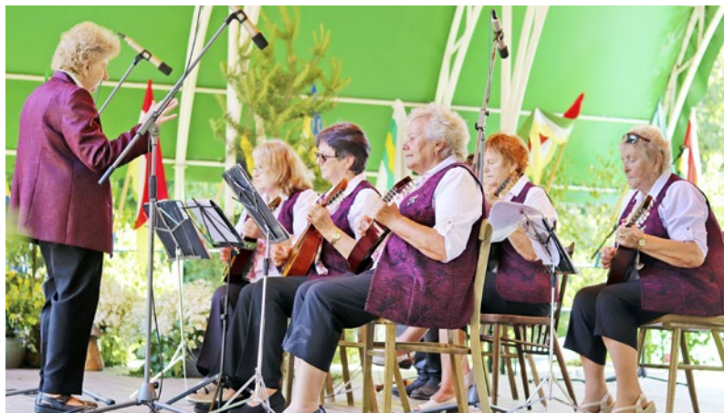
Zvuk mandolín Rajbinušky krásne vynikol. Ak sa vám táto hra páči, pridajte sa ku skupine, noví členovia sú vítaní