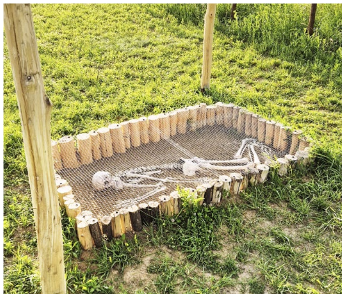
Otvorený hrob ako exponát v skanzene