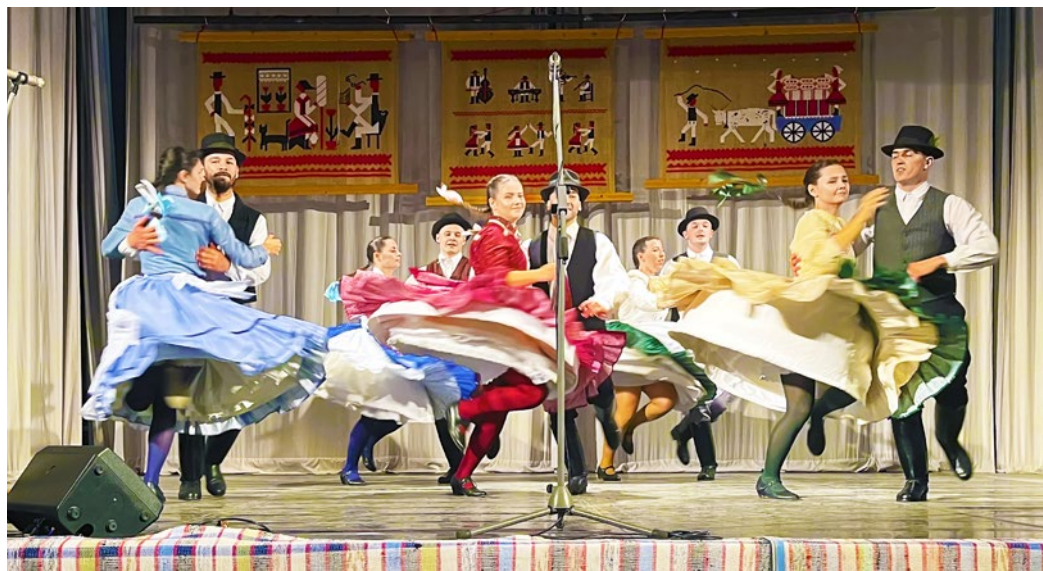
Vo víre tanca

Okrem poskytnutia kultúrneho domu pomohla obec so stravovaním a ubytovaním časti účastníkov, tiež s propagáciou festivalu. „Organizácia pre 180 ľudí bola náročná, ale na prípravu sme mali tri mesiace, takže sme to zvládli. Osobitne si tanečníci a speváci pochvalovali pohostinnosť