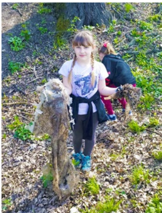
Malá brigádníčka vo Vyšnej Myšli

Tento medzinárodný deň si v rámci úlohy v Recyklohrách pripomenuli aj v ZŠ Ždaňa. Pozbierali smeti a vyčistili chodník medzi Ždaňou a Čaňou, aj príľahlé okolie. Túto trasu využívajú chodci i cyklisti denne, nazbierajú