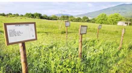
Návštevníci majú k dispozícii množstvo informácií o hroboch

Anton Oberhauser