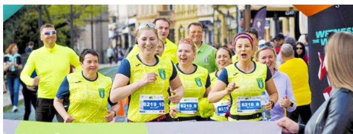
Nižnomyšľianska štafeta v cieľovej rovinke