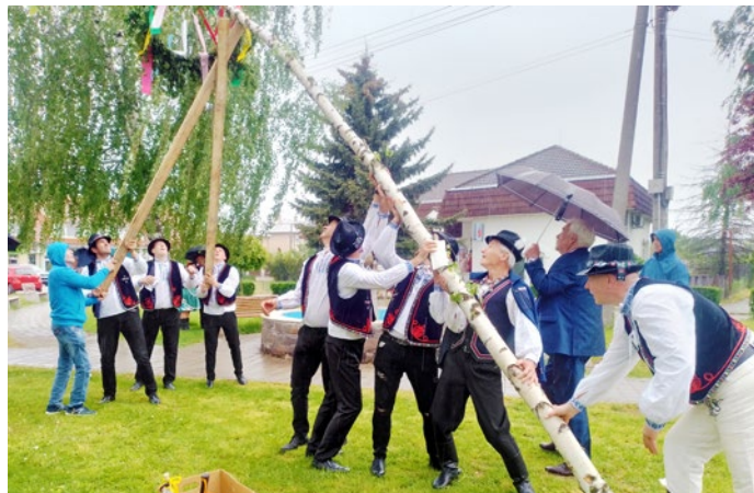
Dážď - nedážď, májka bude stáť